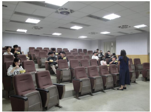
系主任向學生介紹系上概況