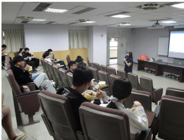
系主任與學生雙向互動