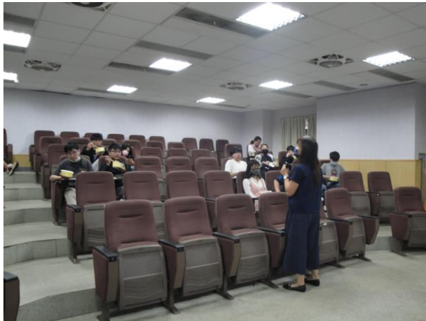
系主任向學生介紹系上概況