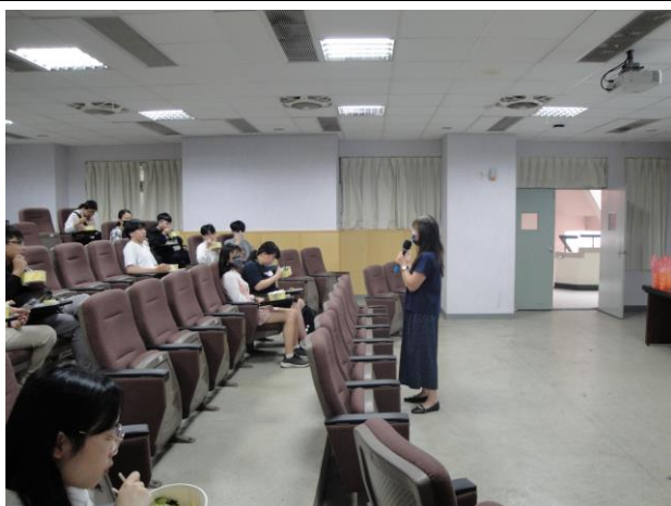
班長及副班長專心聽講。