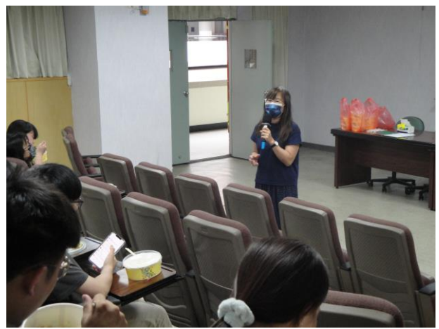
系主任與學生雙向互動