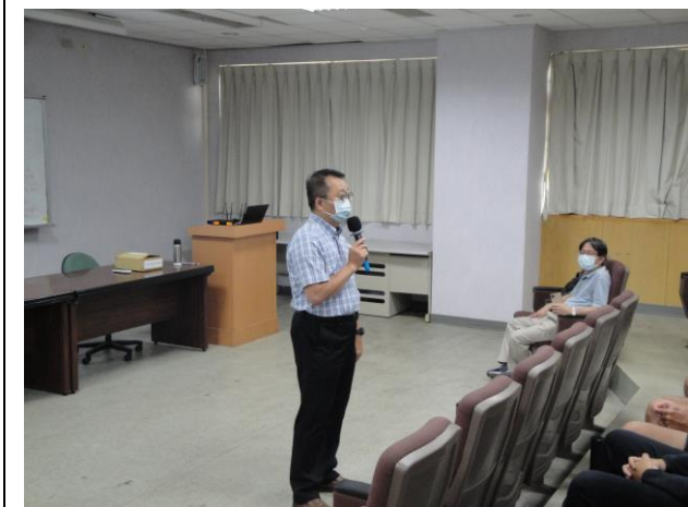
楊總經理講師說明中