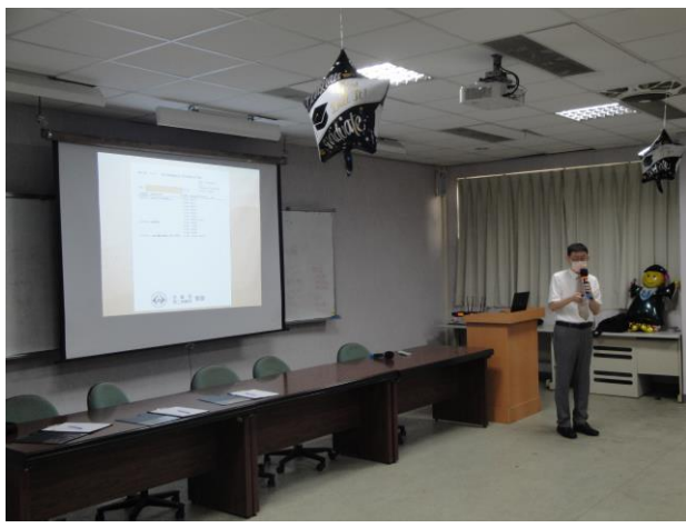
吳科員講師說明中