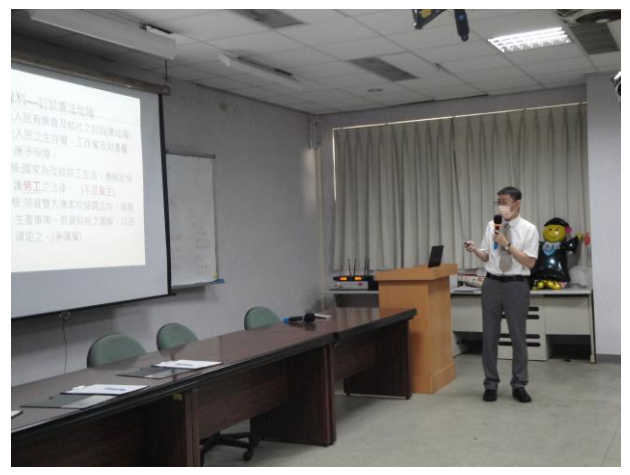
吳科員講師說明中