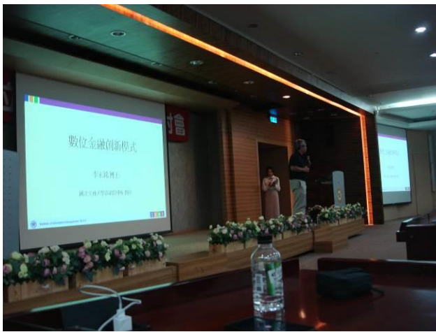
李教授發表專題演講