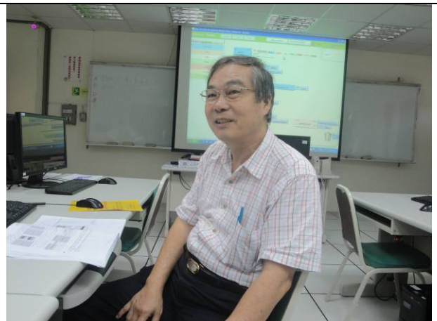
學員正在問講師相關問題