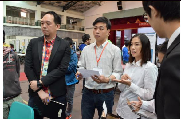
學生展示比賽狀況