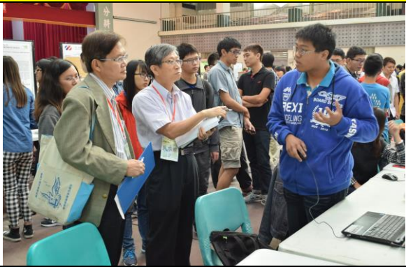
學生展示比賽狀況