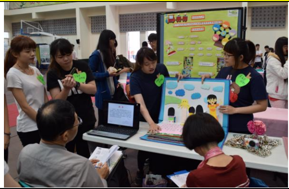
學生展示比賽狀況