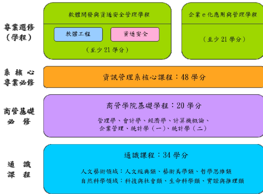
圖二 良好的課程規劃